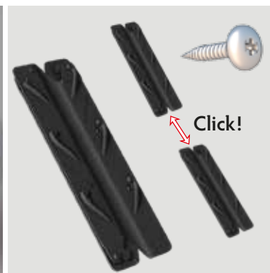
RootBarrier® Connector International Registration No.: DM/081 955