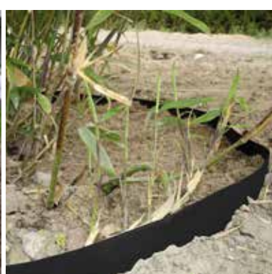
RootBarrier® 420 UV