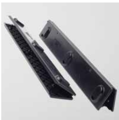
RootBarrier® Click Connection

Für weitere Informationen besuchen Sie bitte unsere Webseite oder kontaktieren Sie uns.